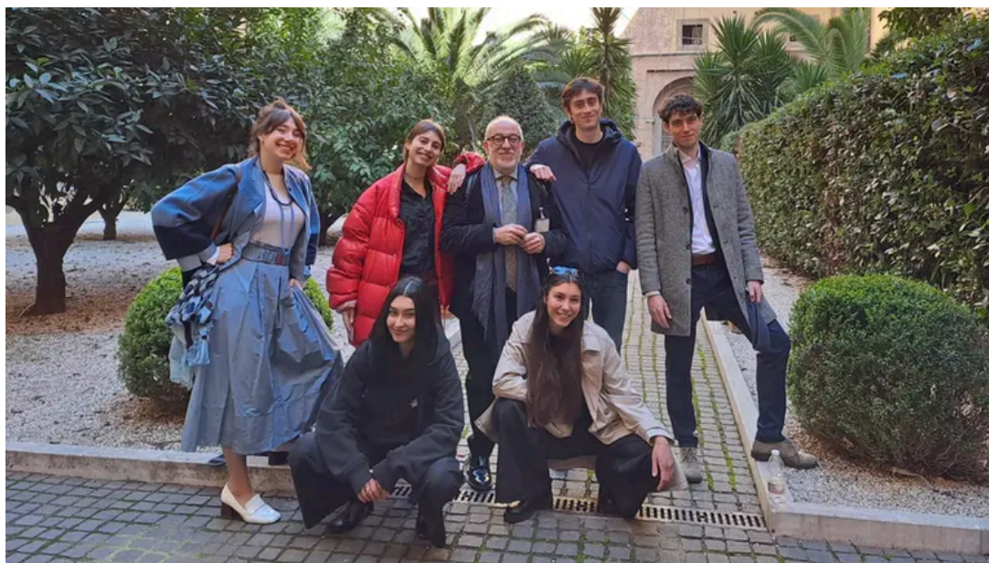
I giovani attori della Compagnia Giovani e il direttore di Marche Teatro

Al termine delle sessioni la Giuria formulerà la proposta al Ministro della Cultura, che procederà alla proclamazione ufficiale della città vincitrice, prevista entro la fine di marzo. Da ricordare che il titolo di Capitale italiana della cultura comporta l'assegnazione di un contributo statale di un milione di euro a sostegno del programma presentato.