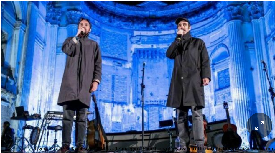
Il vento soffia sulla musica. Dal 15 al 17 maggio a Fano torna il festival diretto dal duo Colapesce-Dimartino.