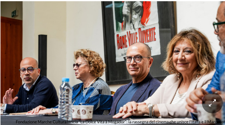
Fondazione Marche Cultura lancia “La Dolce Vita à Mogador”: la rassegna del cinema che unisce l'Italia e il Marocco