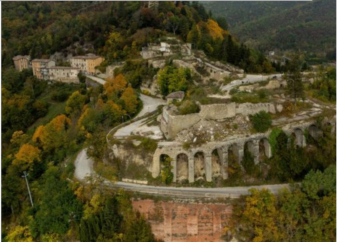
Arquata del Tronto