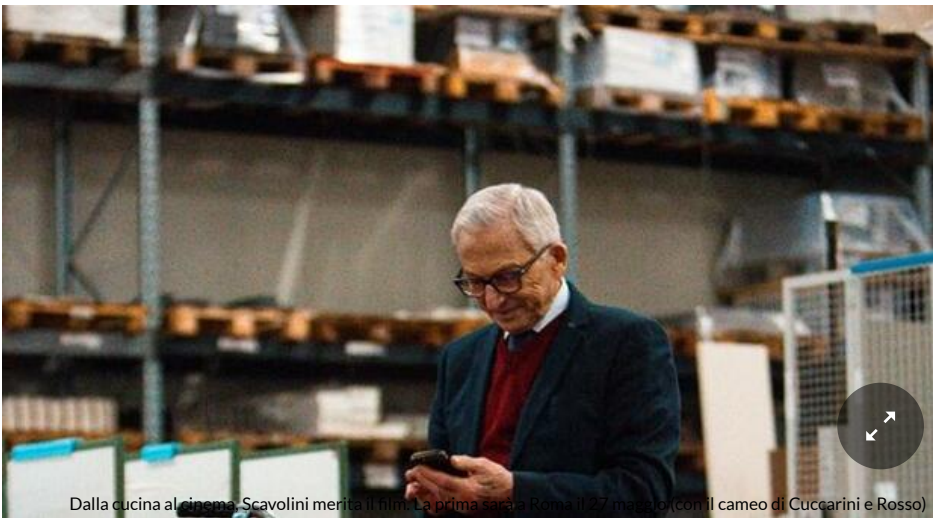
Dalla cucina al cinema, Scavolini merita il film. La prima sarà a Roma il 27 maggio (con il cameo di Cuccarini e Rosso)

La vita di Valter narrata su pellicola, il biopic è diretto dal nipote Mattia Zanca